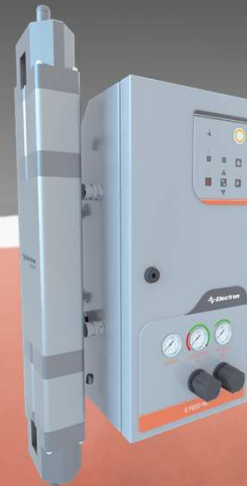
Powder Transfer Pump